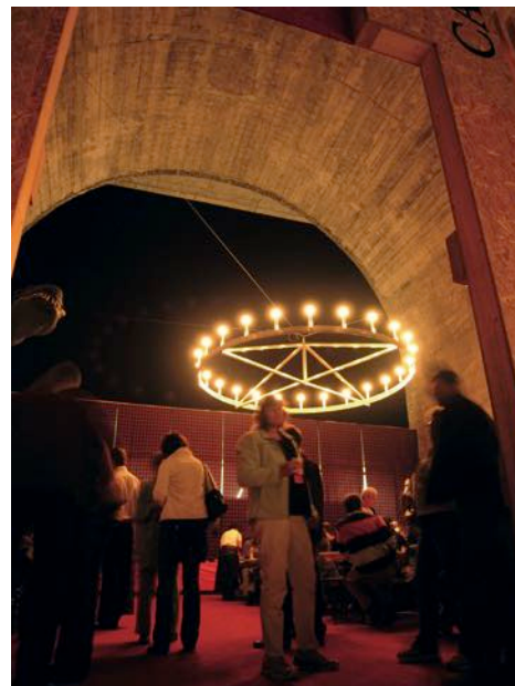
Badenfahrt 2007, „NESSIE'S CASTLE“