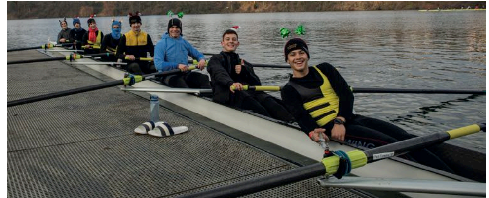
Ruderclub Aargau, Sieger Junioren

tet. Vor 10.30 Uhr wurden Boote gewechselt und die übrigen 8 Teams starteten jetzt in der zweiten Serie. Der Himmel hatte sich bereits aufgehellt. Nach einem wegen Covid vereinfachten Brunch begann die Rangverkündigung bei strahlendem Winterwetter. Strahlen taten auch die Gesichter der Kategorie Sieger/Innen. In der Kategorie Da-