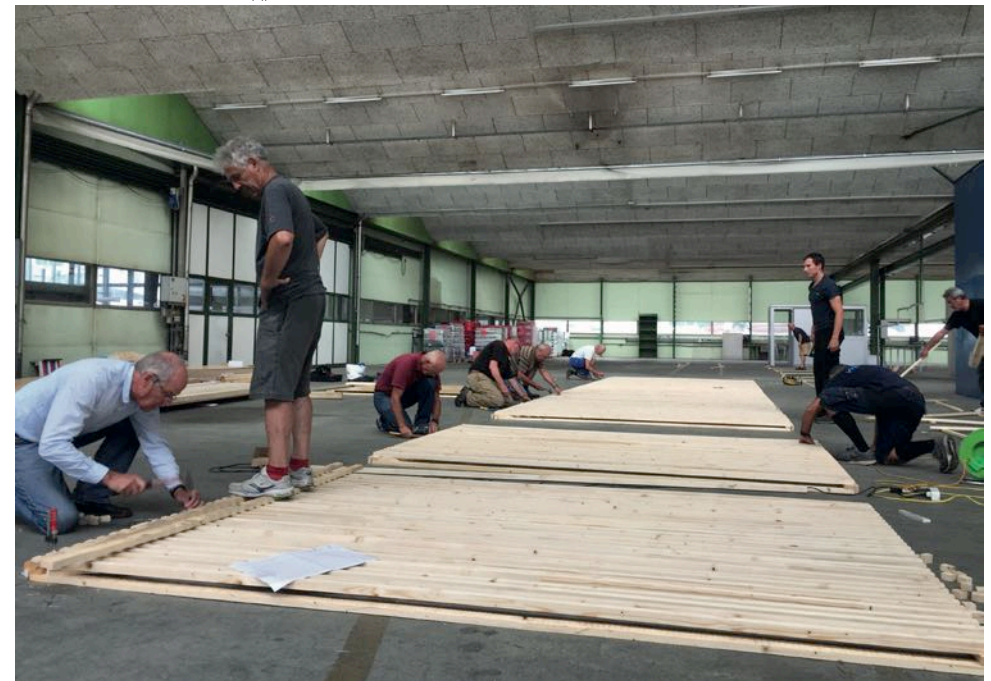
Badenfahrt 2017, Produktion der Fassadenelemente in der leeren DIRALSA-Halle