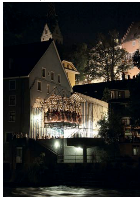
Stadtfest 2012, „HENLEY ON LIMMAT“