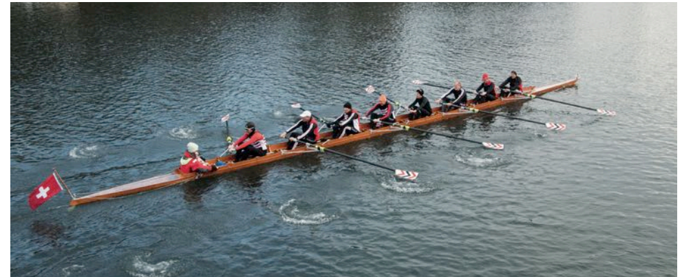
Ruderclub Baden, Sieger Masters

Boot und dann die weiteren mit einem Abstand von 30 Sekunden. Erstmals in der Geschichte dieser Regatta wurde die Strecke von 8.5 km mit einer Wende oberhalb der Brücke Killwangen gerudert. Fast alle schafften die Wende souverän, einige mussten mehrfach ansetzen, was Zeit kos-