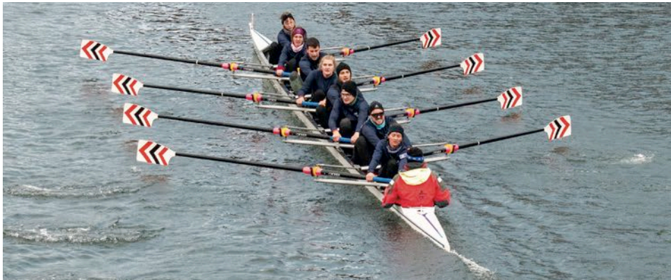
Ruderclub Baden Hochschulachter, Sieger Mixed

fangreichen Brunch mit Selbstbedienung besser nicht anbieten. Um das Gedränge im Vorraum zu vermeiden, machten wir verschiedene Überlegungen. Ist es möglich, die Essensausgabe in die Werkstatt zu verlegen - am besten mit einem Einbahnbetrieb? Bis wir ein gutes, umsetzbares