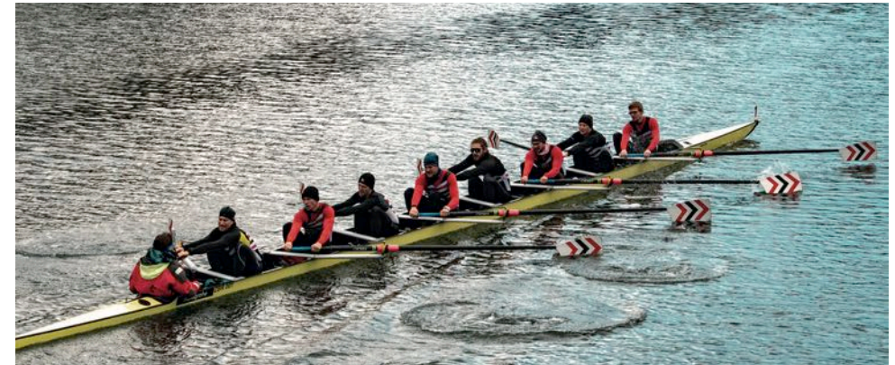
Ruderclub Baden Herren, Pokalsieger Baden Achter Cup 2021

Am 20. Dezember 2003 startete der erste Baden Achter Cup an der Oetwiler Brücke. Bis ins Jahr 2019 blieb es bei dieser Rennstrecke über eine Distanz von 6.5 km. Erstmals wurde die Strecke im Jahr 2021 geändert – mit Kurve – und damit neuen Herausforderungen. Unsere Regatta kurz vor Weihnachten ist zum festen Bestandteil im Jahresprogramm unserer Ruderfreunde und des RCB geworden.