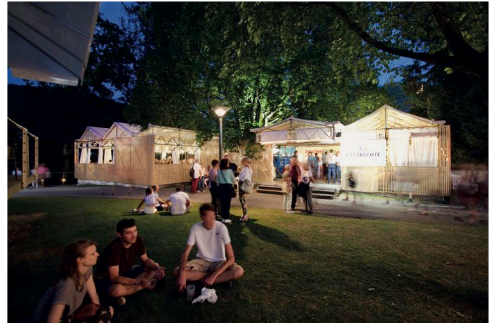
Der RCB an der Badenfahrt 2017, „L'ENTRECÔTE“