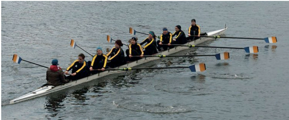
Polytechniker RC Zürich, Siegerinnen Damen