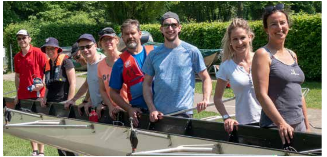
Die Teilnehmenden des Ruderlehrgangs 2018

Ruderclub Baden, Postfach, 5432 Neuenhof www.rcbaden.ch