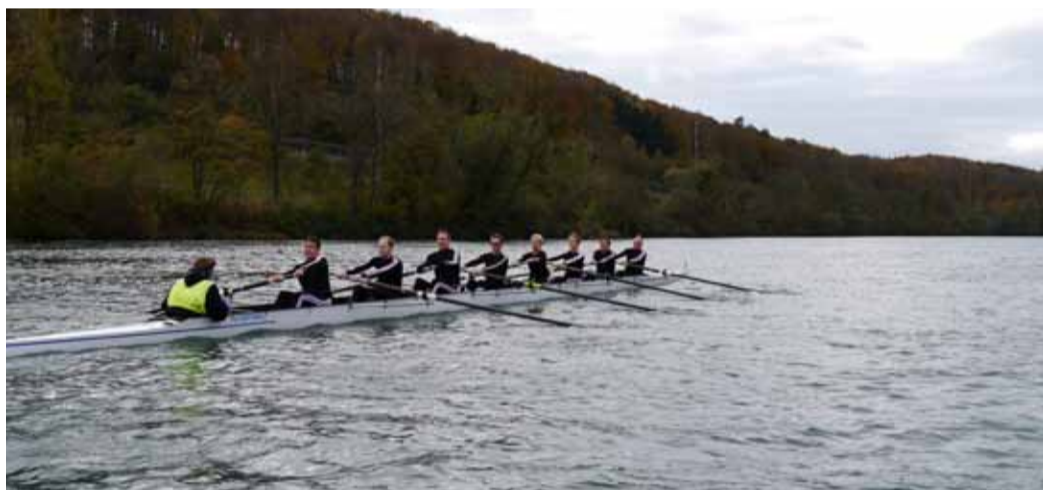
Rhythmisch bewegen die Masters 2 den Achter über die Strecke