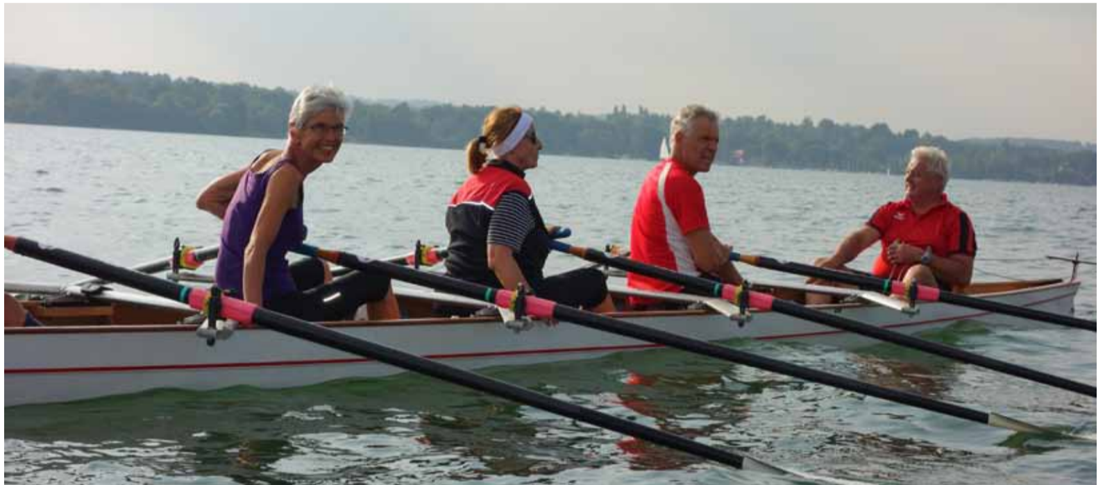
Nicht wie auf der Limmat aber auch schön, die Wanderfahrt auf dem Ammersee und Starnbergersee