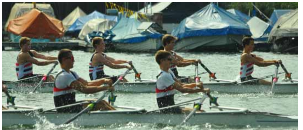
Die RCB-Junioren messen sich im Vierer!