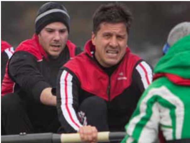
Unser neue Vizepräsident am BADEN-Achter Cup im Einsatz