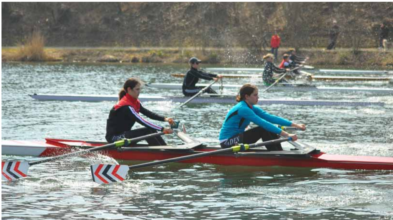
Rennsimulation im Osterlager zur Vorbereitung auf die Saison

Nachtrag: Das Training bei schlechtem Wetter hat sich gelohnt, war es doch an der ersten Regatta in Lauerz ähnlich regnerisch. Davon liessen wir uns aber nicht mehr ablenken.