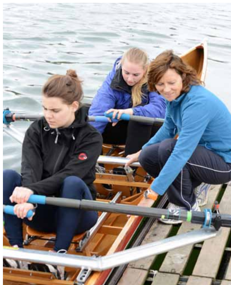
Auch das richtige Einsteigen ins Boot will gelernt sein!