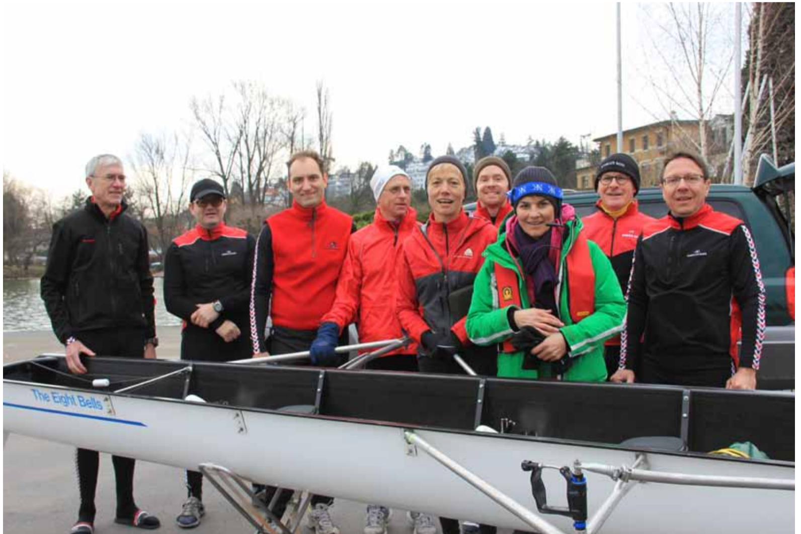
Die Masters 2: Inzwischen ein eingespieltes Team!