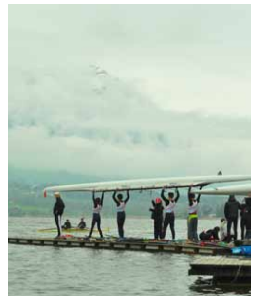
Mystische Stimmung am Lauerzersee