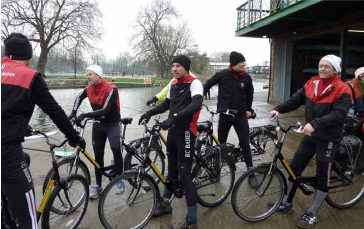
Statt auf der Themse rudern die Masters 2 auf der Cam und sind zur Abwechslung auch mal mit Fahrrad unterwegs!