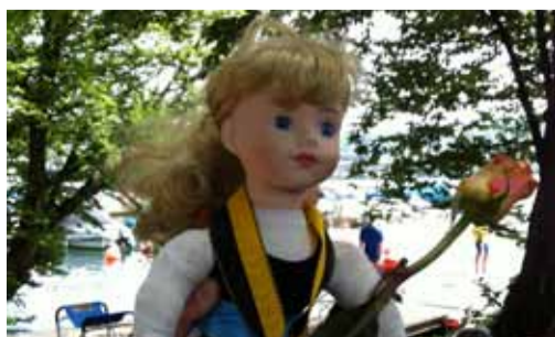
Gloria (oder Stella?)