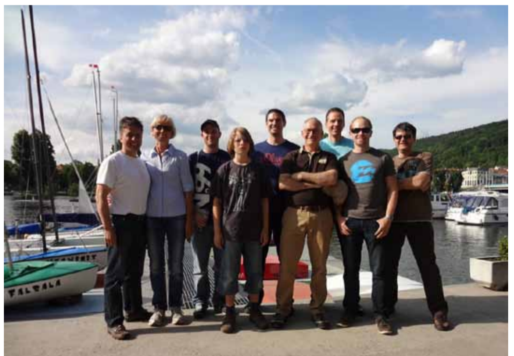
Die Masters 2 unterwegs in fremden Gefilden und auf unbekanntem Gewässern

Am Sonntagmorgen bummelten wir durch die Heidelberger Altstadt und genossen die kurze Fahrt mit der Bergbahn hoch zum Schloss. Nach der Besichtigung der Ruine, des Schlosshofes und des grossen Fasses genossen wir die herrliche Aussicht über Heidelbergs Altstadt und machten uns nach einem leichten Mitta-