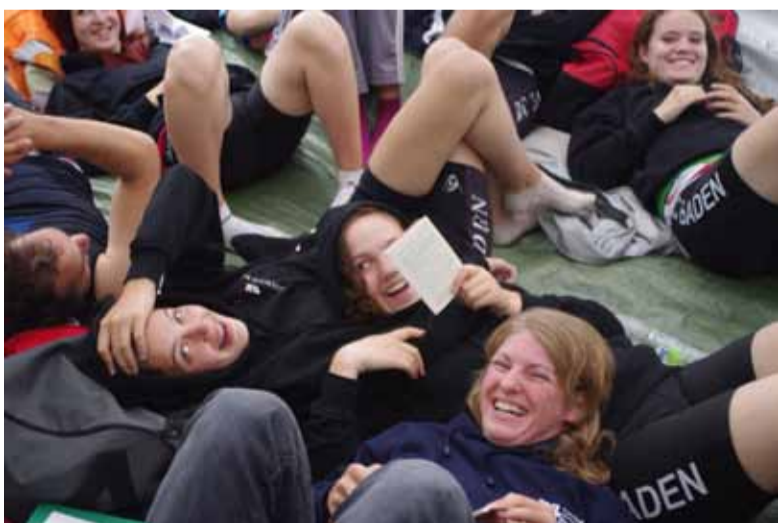
Es herrscht gute Laune bei unseren Regattierenden in Frankreich