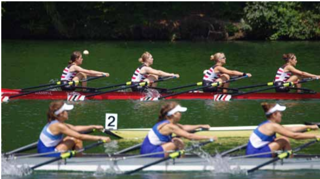
Der U17-Doppelvierer auf Medaillenkurs