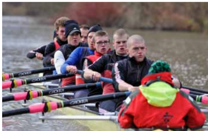
BADEN Achter Herren 2