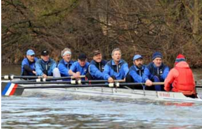
WSV Waldshut Masters