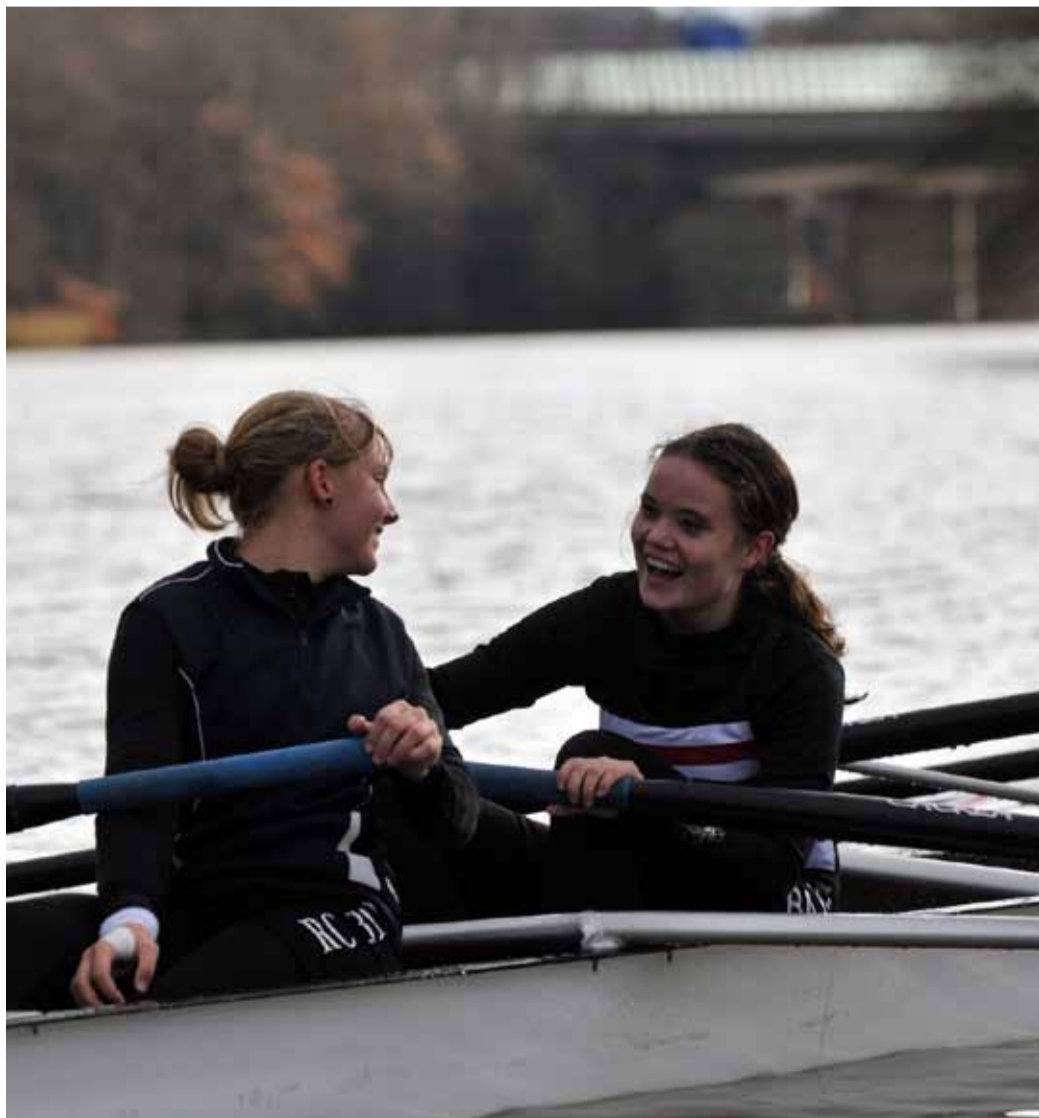
Die glücklichen Juniorinnen im Ziel wissen noch nichts von ihrem Glück