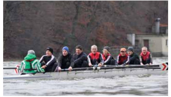
BADEN Achter Masters 2