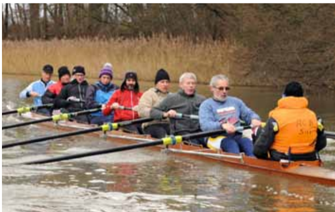
BADEN Achter Henley