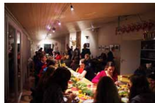
Festliche Stimmung im Clubraum