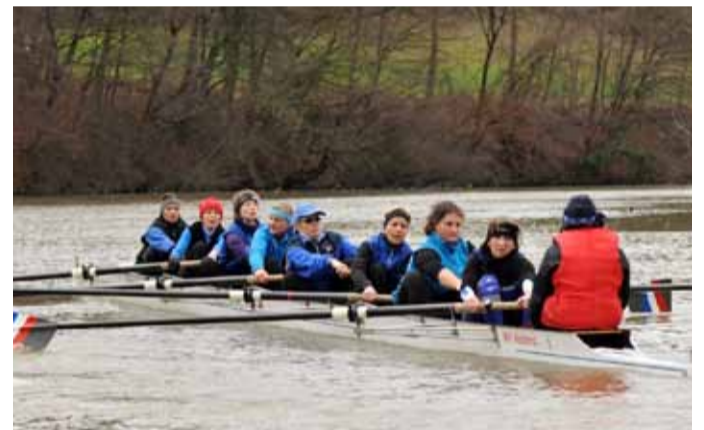
WSV Waldshut Frauen