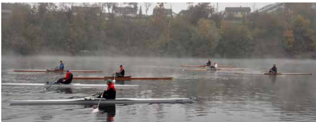
Auf der dampfenden Limmat rudern die Prosecco-Cupler Richtung Ziel

Normalerweise werden die Ruderwettkämpfe vor allem von der jüngeren Generation bestritten. Um auch der älteren Semestern die Möglichkeit zu geben sich an einem Wettkampf zu messen, an dem ihrem Alter gebührend Rechnung getragen wird, hat der Ruderclub Baden den Prosecco-Cup eingeführt, einem Skiffrennen nur für die Ü27-Jährigen. Speziell: Auf die über die 6 Kilometer lange Strecke erruderte Zeit werden pro Altersjahr unter 50 sechs Sekunden hinzugezählt, pro Altersjahr über 50 sechs Sekunden abgezählt. Daraus ergibt sich schliesslich die Endzeit.