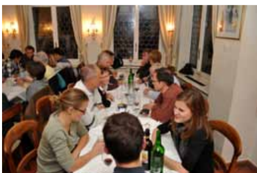
Gemütliches Beisammensein im Stübli