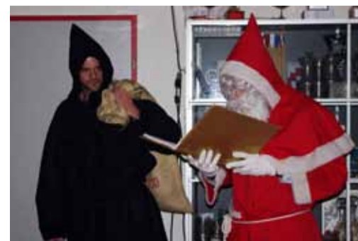
Schmutzli und Samichlaus dieses Jahr ganz ungeschminkt