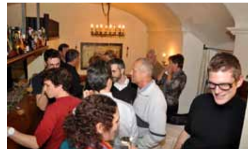
Angeregte Diskussionen beim Apéro