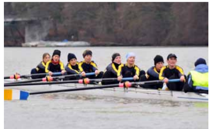
Polytechniker RC Zürich Frauen