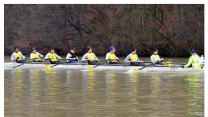
RC Hallwilersee 2