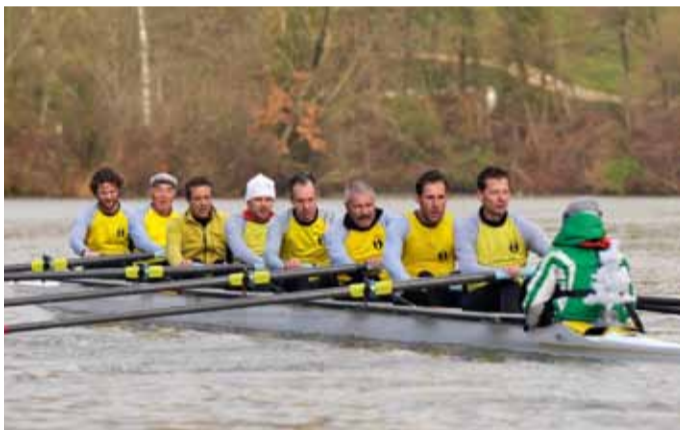
RC Hallwilersee Sunset-Team