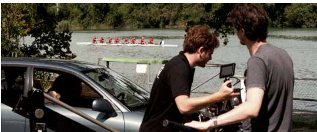
Im Hintergrund der Filmszenarie gleitet ein Badenachter über die Limmat