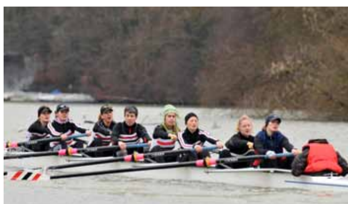
BADEN Achter Frauen „Sunrise-Team“