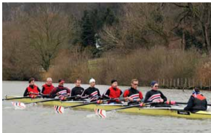
BADEN Achter Masters