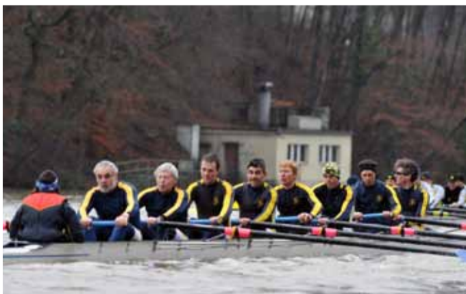
Polytechniker RC Zürich Masters