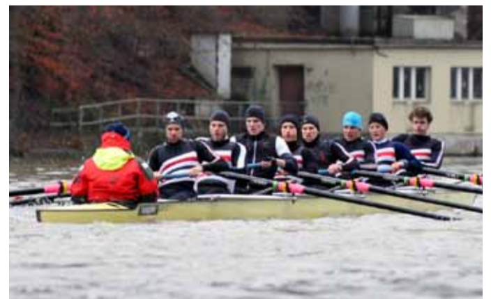
BADEN Achter Herren 1