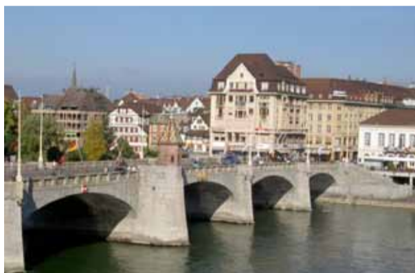
Der Basel Head trumpft mit bestem Wetter

Das Aufregung ist haben wir dieses Jahr schon das eine oder andere Mal geübt, trotzdem benötigen wir mehr Zeit als geschätzt, bis wir