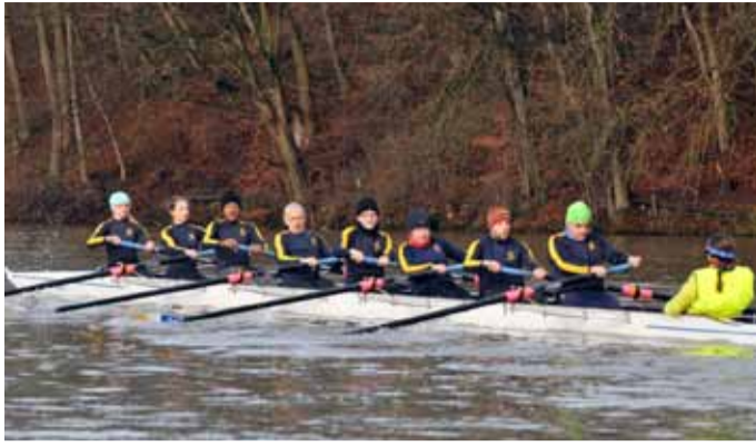
Polytechniker RC Zürich Starters