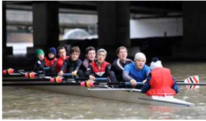
BADEN Achter Junioren