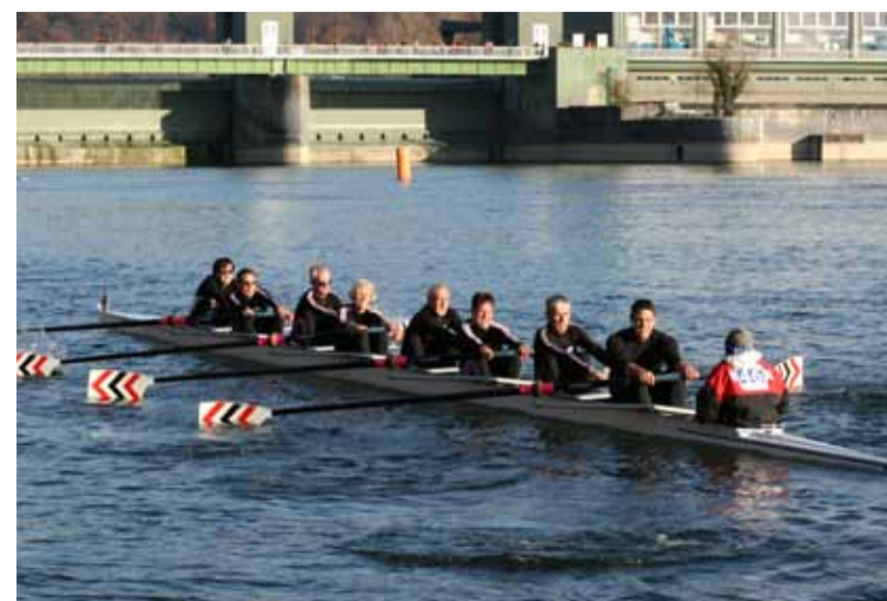
Der Masters 2-Achter unterwegs auf dem Rhein