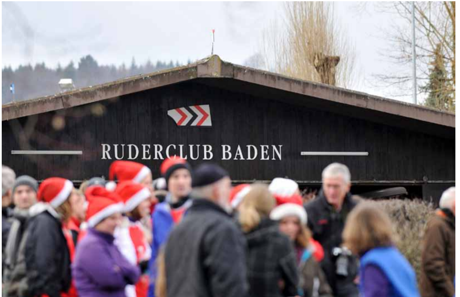
Und alle sind da... es ist BADEN Achter Cup-Zeit!