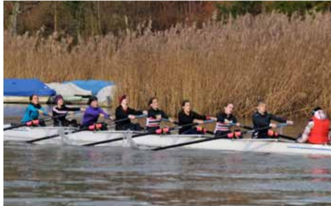
BADEN Achter Juniorinnen