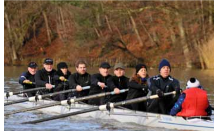
BADEN Achter Starters