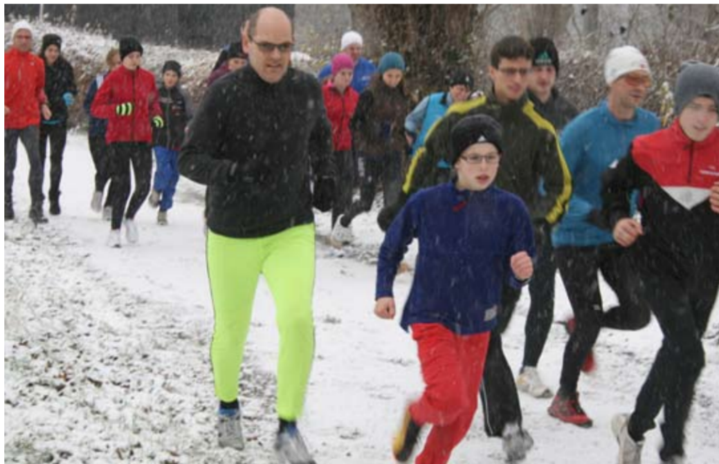
Ja, denn ihr seid Ruderer!

Wetter: Leichter Schneefall, bedeckter Boden, Temperatur ca. -2°C