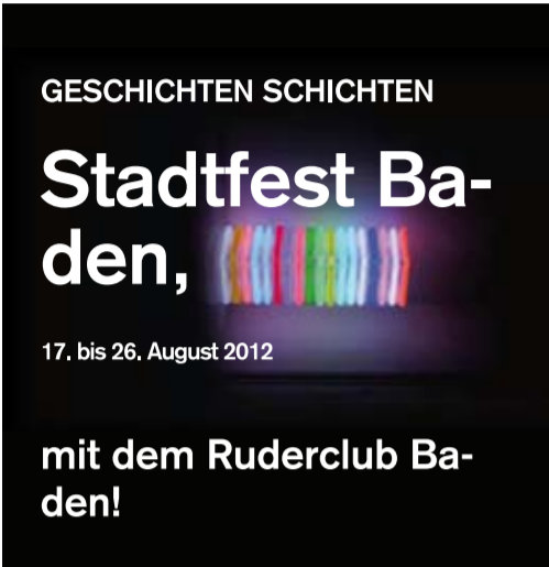
Das bereits adaptierte Logo