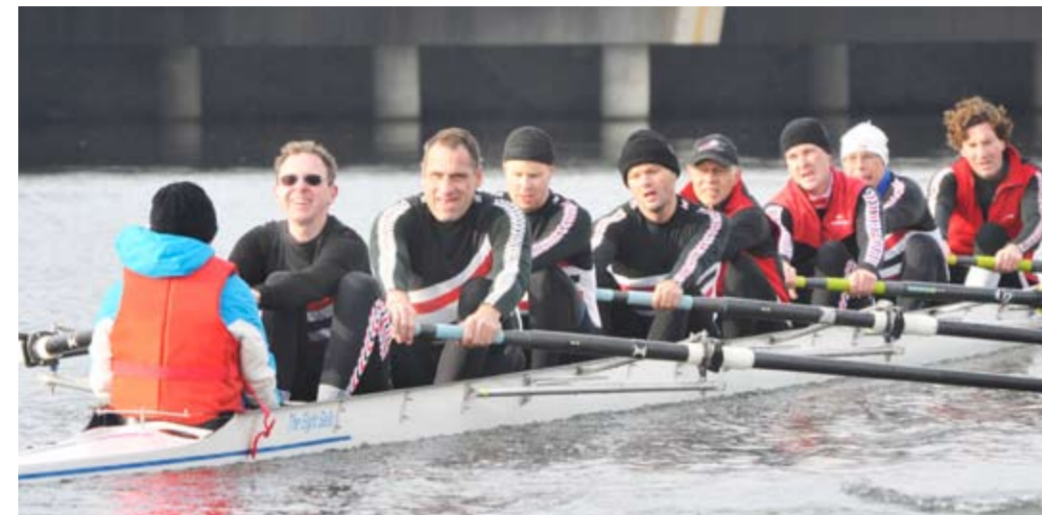
BADEN Achter Masters 1