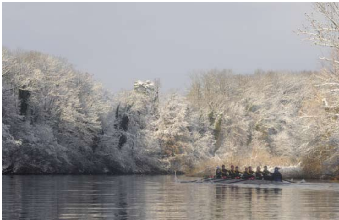
Ein Ruderfest als Wintermärchen

Mit kleiner Verzögerung konnte dann um halb zwei Uhr die Siegerehrung zelebriert werden. Am oberen Ende der Rangliste gibt's nichts Neues: BADEN Achter Herren 1 vor BADEN Achter Masters 1 und BADEN Achter Herren 2, auf dem vierten Rang wie immer Polytechniker Masters. Stark verbessert hatten sich allerdings die Badener Juniorinnen, die sowohl mit ihrer guten Zeit als auch mit einer guten technischen Performance alle beeindruckten: sie gewannen auch die Kategorie Junioren. Nebst allen Teilnehmenden und der Tatsache, dass wir es wieder einmal geschafft haben, bei solchem Wetter so schön zu rudern, feiert der Ruderclub Baden bei diesem Anlass auch den Sieg im President's Cup. Fast hätte ich geschrieben „jeweils“, aber theoretisch kann der Preis für den besten