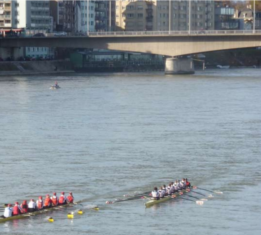
RCB Masters 1 beim verhängnisvollen Überholmanöver mit dem Breisacher RV

bei Ankunft am Regatta-Platz zu spüren, dass dieser Anlass ein Erfolg wird. Und so war es. Nach sauberer Instruktion im altehrwürdigen Klingenthal-Museum, dem Auftriggern der Boote und dem Wassern über einen provisorischen Steg, gab der Schiedsrichter um 14.00 Uhr das Startkommando für den ersten der 30 Achter, die dann einer nach dem andern unter den Blicken der zahlreichen Zuschauer, Spaziergänger und Stadtbummler unter der