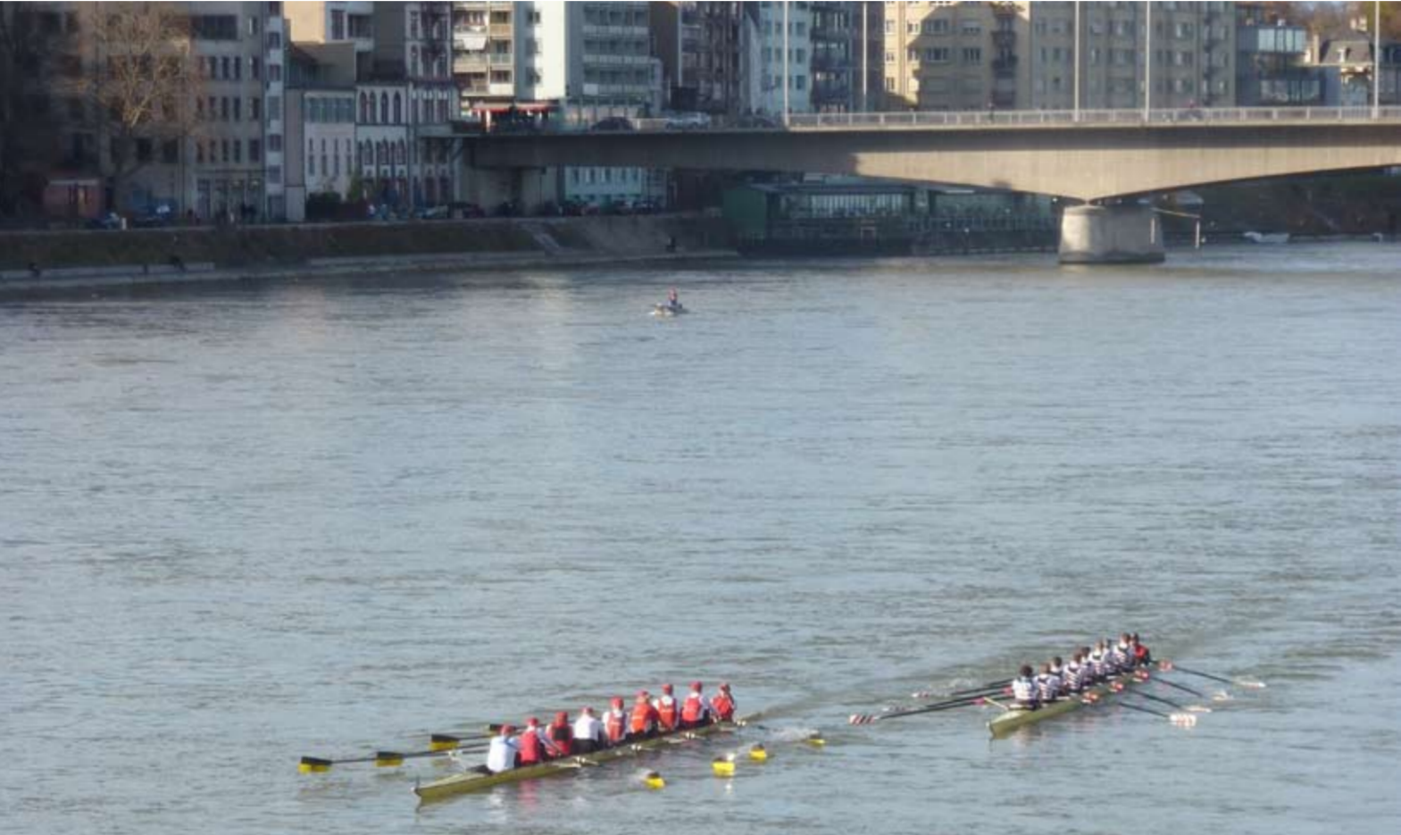
RCB Masters 1 beim verhängnisvollen Überholmanöver mit dem Breisacher RV

Ich wollte eigentlich einem der Teilnehmenden die Freude überlassen, für den Kontakt vom ersten BaselHead zu berichten. Aber als ich am Rheinufer unter Tausenden von Zuschauern flanierte und das herrliche Herbstwetter genoss, befürchtete ich plötzlich, dass wohl jeder andere ausser mir irgendetwas geschrieben hätte wie „...und auch das Wetter stimmte“. Aber das würde zu wenig der Wahrheit entsprechen. Und ich beschloss, selber zu schreiben.