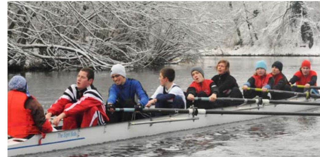
BADEN Achter Mixed