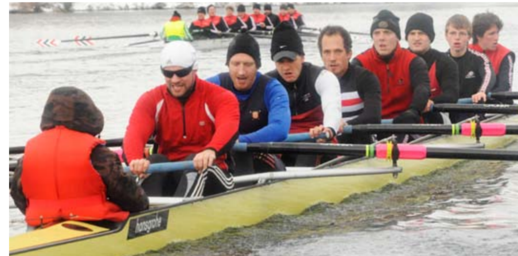
BADEN Achter Herren 2