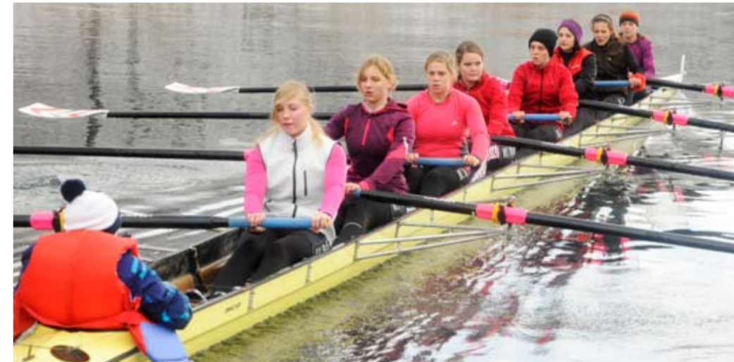
BADEN Achter Juniorinnen