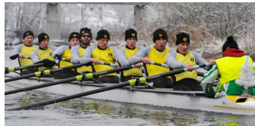
RC Hallwilersee Masters