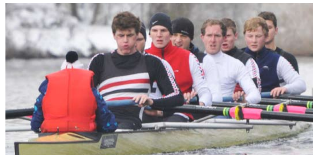
BADEN Achter Herren 1