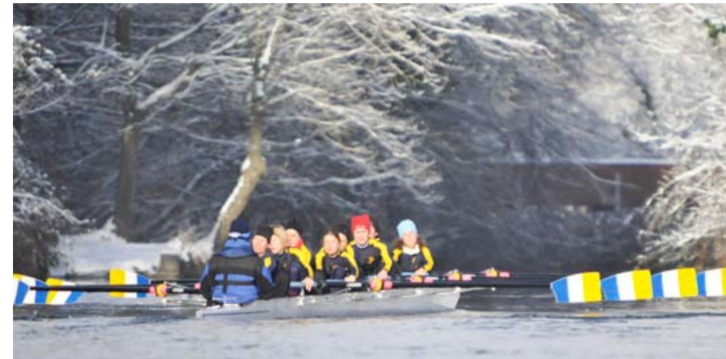
Polytechniker RC Zürich Frauen