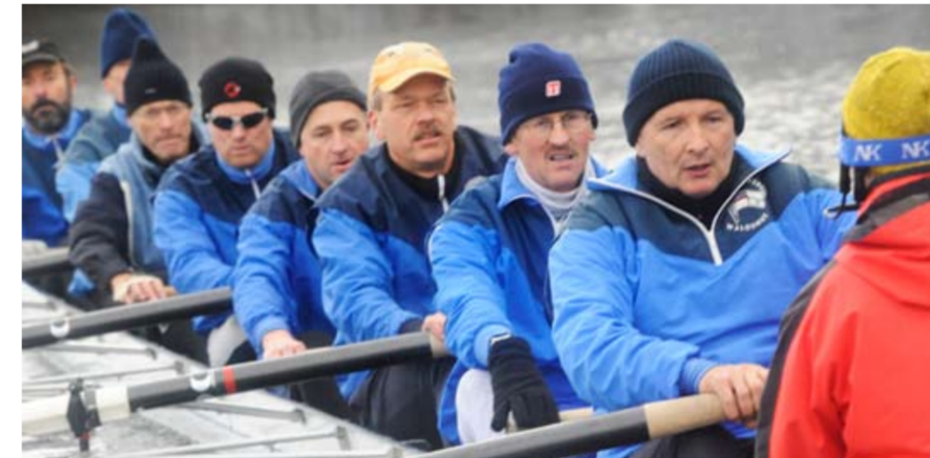
WSV Waldshut Masters