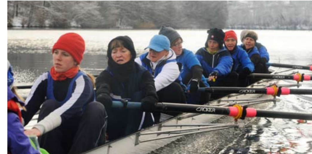
WSV Waldshut Frauen