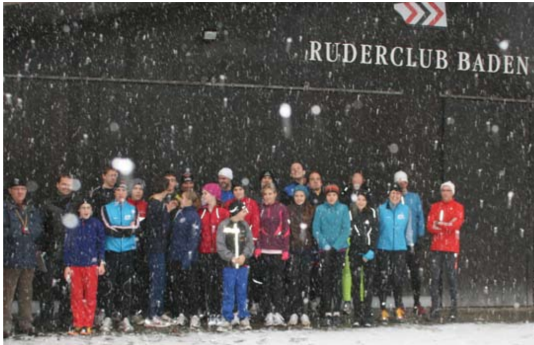
Müssen wir da wirklich raus...?