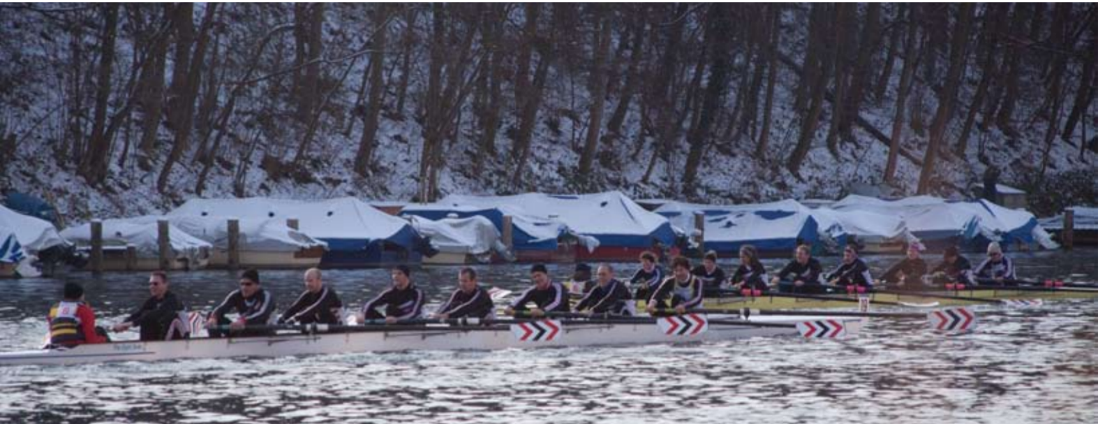
Die Masters 1 und die Frauen des RCB kurz vor dem Ziel

Als Nicht-Zürcher darf ich es ja sagen: Bescheidenheit ist wohl nicht die Zier der Zürcher. Doch dies ist schnell vergessen, denn die Regatta ist vom Züricher Regattaverein super organisiert und sie hat es in sich. Bei winterlichen Temperaturen wird das Boot direkt am Rheinufer in Ellikon aufgeriggert.