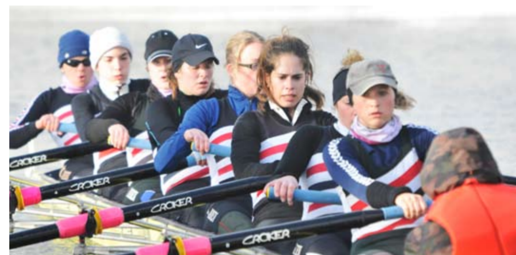
BADEN Achter Frauen