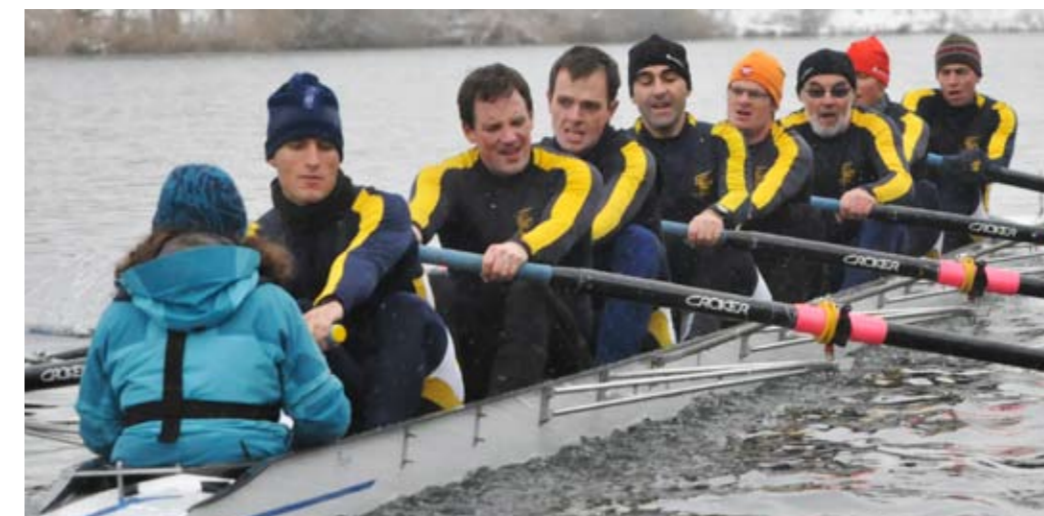
Polytechniker RC Zürich Masters