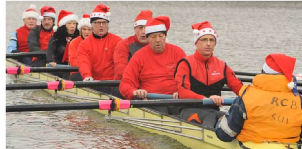
BADEN Achter Masters 3