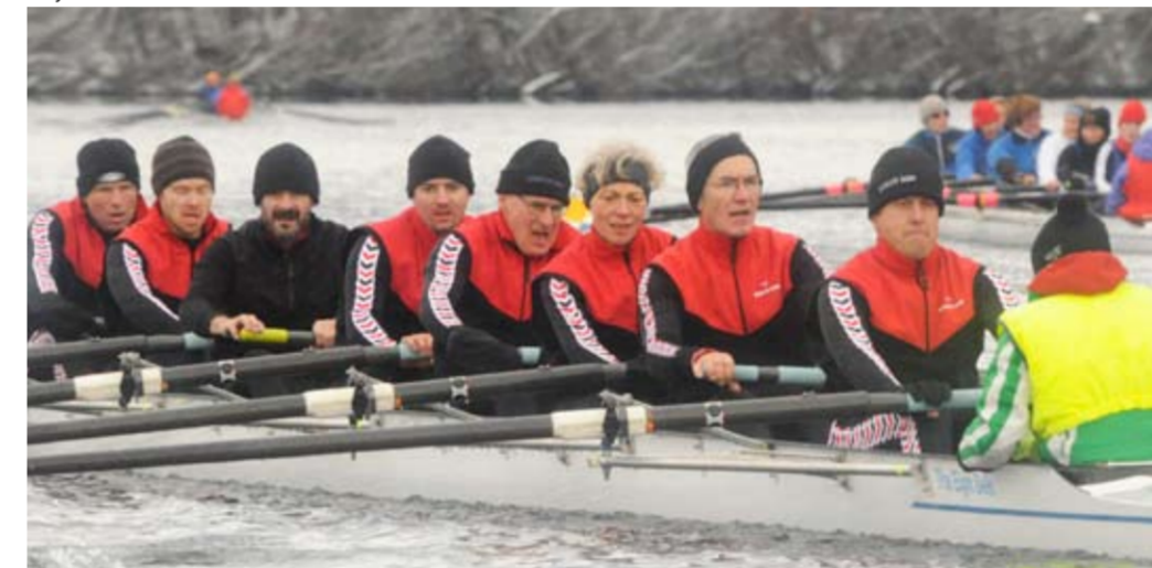
BADEN Achter Masters 2